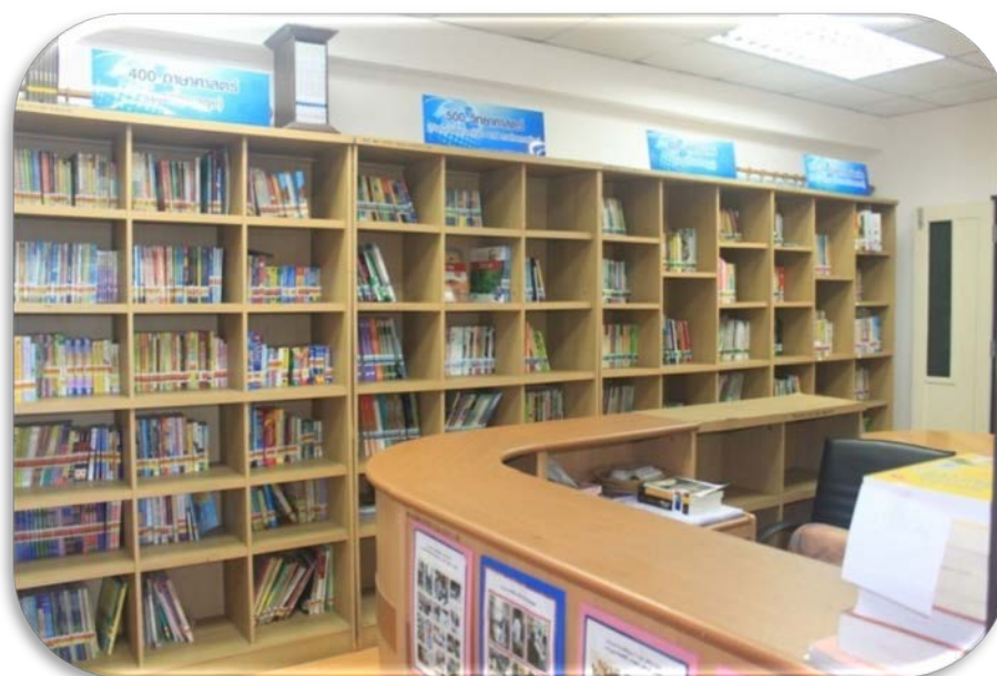
มุมหนังสือทั่วไป แบ่งตามหมวดหมู่