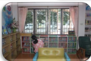
มุมเด็กและเยาวชน