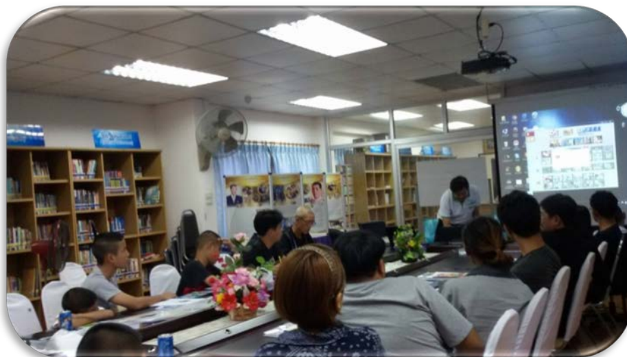
บรรยากาศภายในห้องประชุมชั้น 2