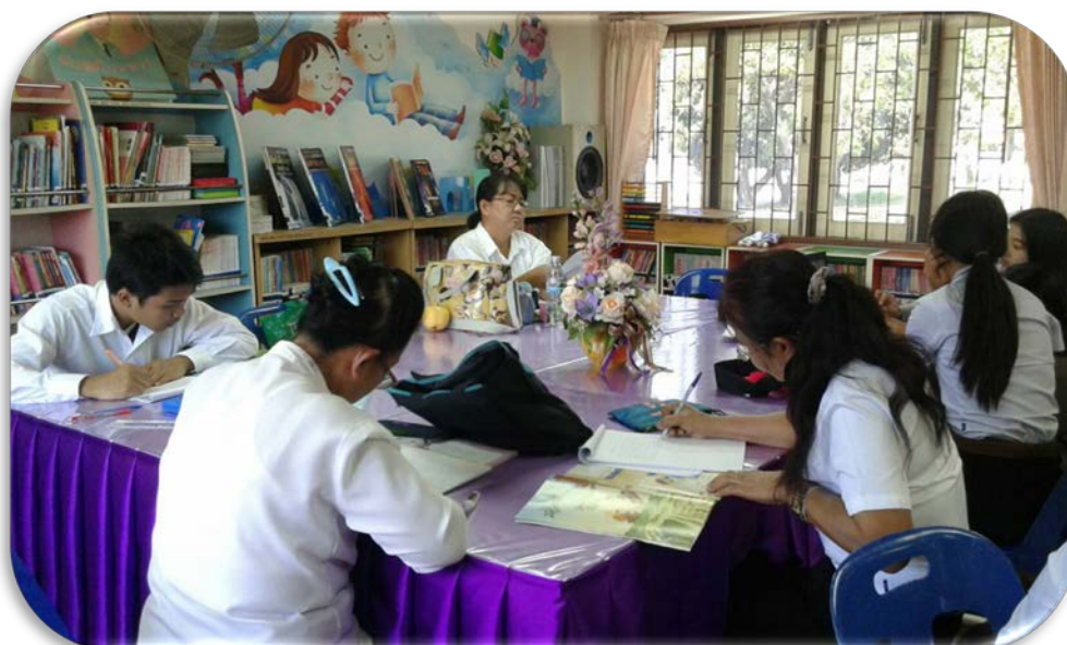
ที่นั่งอ่านหนังสือบริเวณ ชั้น 1