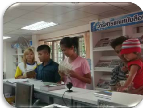
บริเวณเคาน์เตอร์ให้บริการยืม – คืน