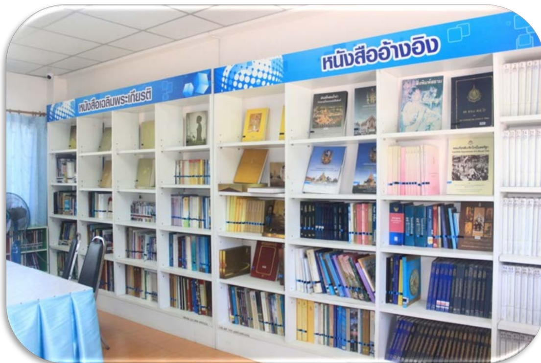
มุมหนังสือเฉลิมพระเกียรติ และหนังสืออ้างอิง

- ชั้น 2 ให้บริการมุมหนังสืออ้างอิง หนังสือเฉลิมพระเกียรติ มุมหนังสือทั่วไป ทั้ง 10 หมวด และบริการอินเทอร์เน็ต และมีการกั้นห้องเป็นห้องประชุมใช้สำหรับการทำกิจกรรมต่าง ๆ