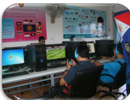
บรรยากาศภายในศูนย์อาเซียน